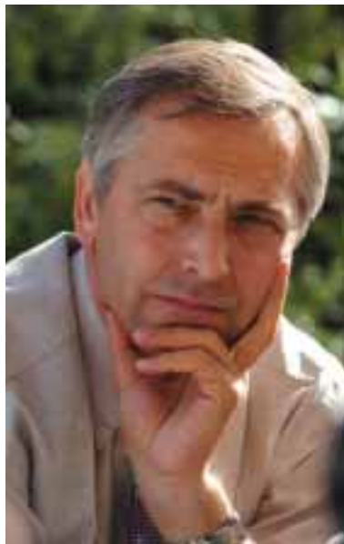
Ján Figel 1

C'est dans un tel contexte que le Conseil et le Parlement européen ont adopté, à la fin de 2006, un cadre européen des compétences clés pour l'éducation et la formation tout au long de la vie. Pour la première fois au niveau européen, ce cadre définit les compétences clés dont les citoyens ont besoin pour leur épanouissement personnel, leur intégration sociale, la pratique d'une citoyenneté active et leur insertion professionnelle dans une société fondée sur le savoir. Dans les États membres, les systèmes d'éducation et de formation initiaux devraient promouvoir le développement de ces compétences au bénéfice de tous les